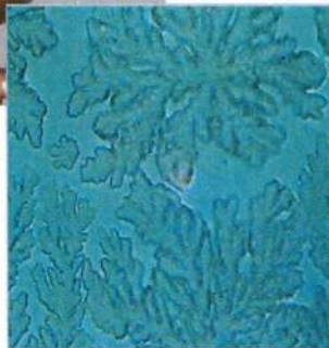
Kristalstructuur van met Aquarius Vitaliser® behandeld water