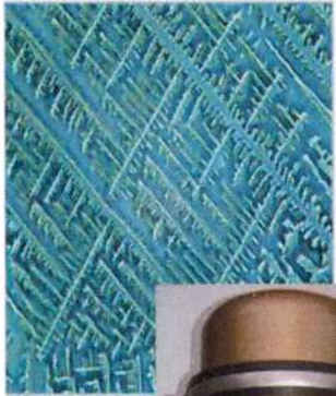
Kristalstructuur van onbehandeld belast water

BIJ U THUIS EN PROEF VITALE BRONKWALITEIT VAN UW LEIDINGWATER